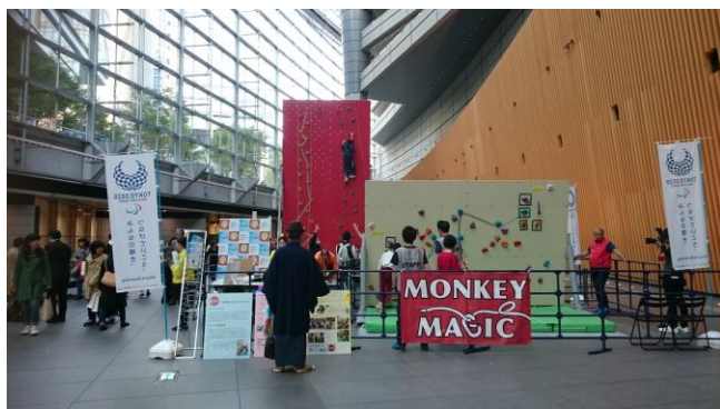
ヒューマンライツ・フェスタ2017(東京都)での様子