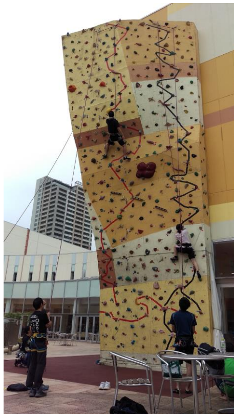
筑波技術大学体育集中授業(茨城県)での様子