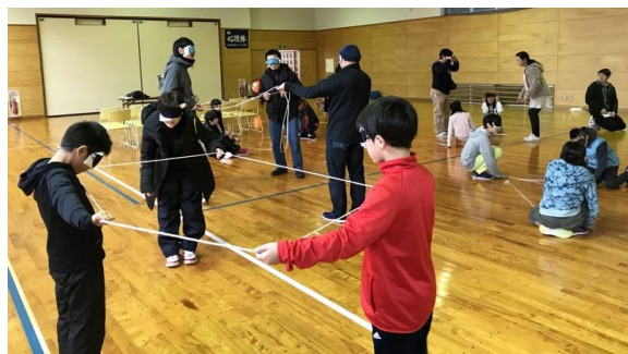
ながい寺子屋 強みをひき出すダイバーシティ体験！おやこクライミング教室(山形県)での様子