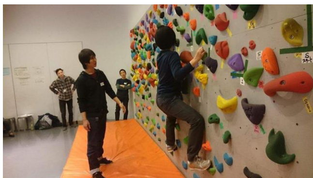
武蔵野プレイスボルダリング体験(東京都)での様子