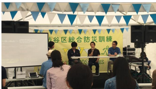
渋谷防災フェス2017(東京都)での様子